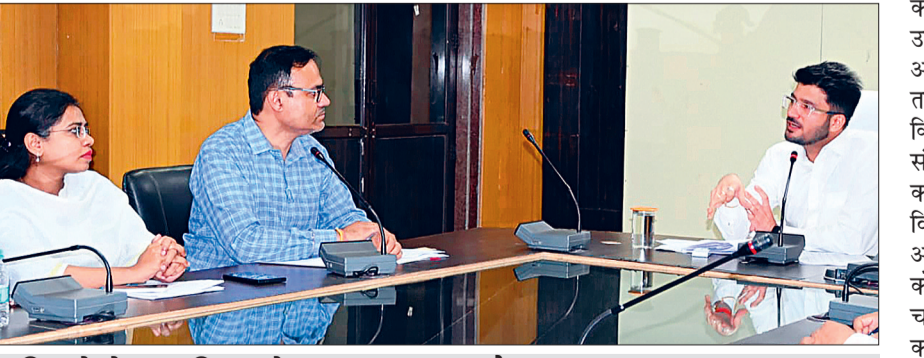
8 मिलरों ने 50 प्रतिशत से कम जमा कराया है चावल इसी प्रकार एफसीआई में 84 मिलरों को जारी डीओ का अनुपातिक चावल 219472 मेट्रिक टन जमा करना है जिसमें से अब तक 150846 मेट्रिक टन चावल जमा किया गया है। 18 मिलरों ने 50 प्रतिशत से कम चावल जमा कराया है, जिसमें जे.डी. एचो इंडस्ट्रीज, लक्ष्मी ट्रेडर्स, श्री बालाजी राइस मिल, जयराम राइस मिल, श्री कृष्णा राइस मिल, आशा राइस मिल, श्री राम एगो इंडस्ट्रीज एवं सेठ बंशीधर केडिया चावल शामिल हैं।